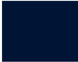
ähnl. RAL 5011 Stahlblau