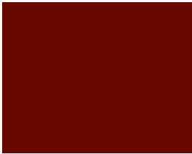
ähnl. RAL 3004 Purpurrot