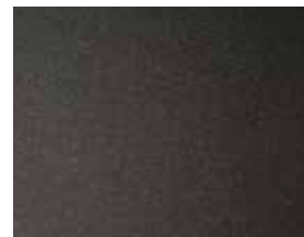
ähnl. DB 703 Eisenglimmer