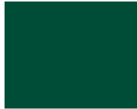
ähnl. RAL 6005 Moosgrün