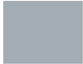
ähnl. RAL 7001 Silbergrau